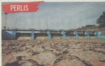
PERLIS KERAJAAN Perlis bakal mengemukakan permohonan cutuan bekalan air selepas paras air di Empangan Timah Tasoh, Kangar semakin berkurangan.