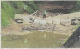
KAKITANGAN Paip sedang meninjau keadaan Sungai Mentiga yang surut hingga menyebabkan loji di Chini gagal menampung bekalan air mentah seperti biasa.