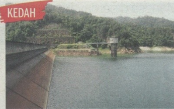
KEDAH BEBERAPA empangan yang makin menyusut di Kedah mendorong kerajaan negeri menghantar bekalan melalui lori tangki.