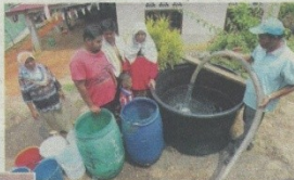
PENDUDUK di Felda Chini 3 mendapatkan air dari lori tangki yang disediakan pihak Paip sejak 11 hari lalu.